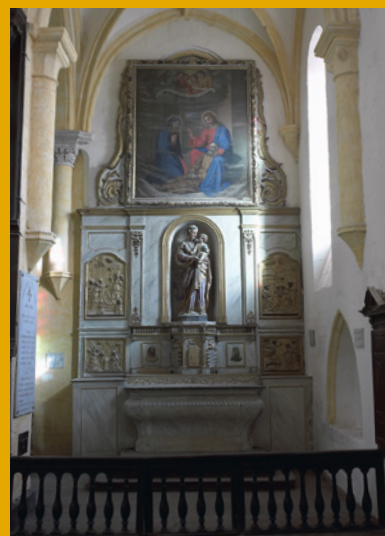
Le retable en 2003

Aujourd'hui le retable dédié à saint Joseph a retrouvé sa splendeur, d'autant plus que son estrade en parquet, anciennement affaissée, a entièrement été refaite à neuf. Cette restauration terminée en juin 2016 a été conduite par l'entreprise Malbrel Conservation. L'opération a été financée par la Ville de Figeac, le Département du Lot, la Région et la DRAC pour un coût total de 32.800 € HT.