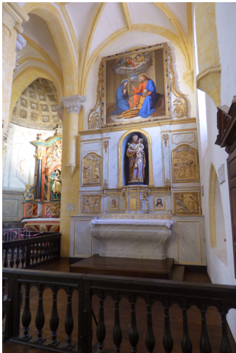
Le retable en juin 2016

La chapelle Saint-Joseph, située dans le bas-côté sud de l'église Notre-Dame-du-Puy, vient de retrouver un nouvel éclat. Chaque élément de la chapelle a fait l'objet d'un soin attentionné : autel, décor sculpté, statue, tableau, sans oublier le parquet.